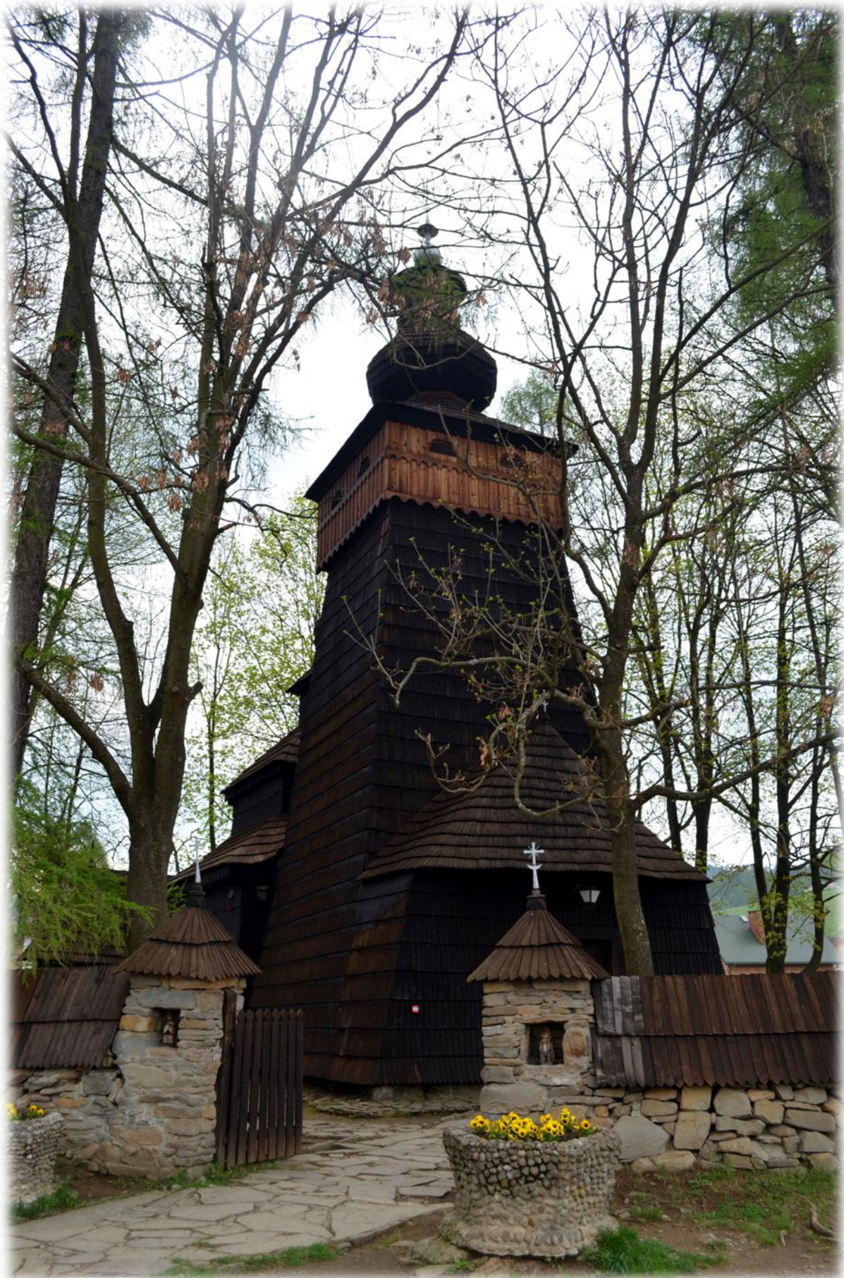
Cerkiew w Powroźniku.