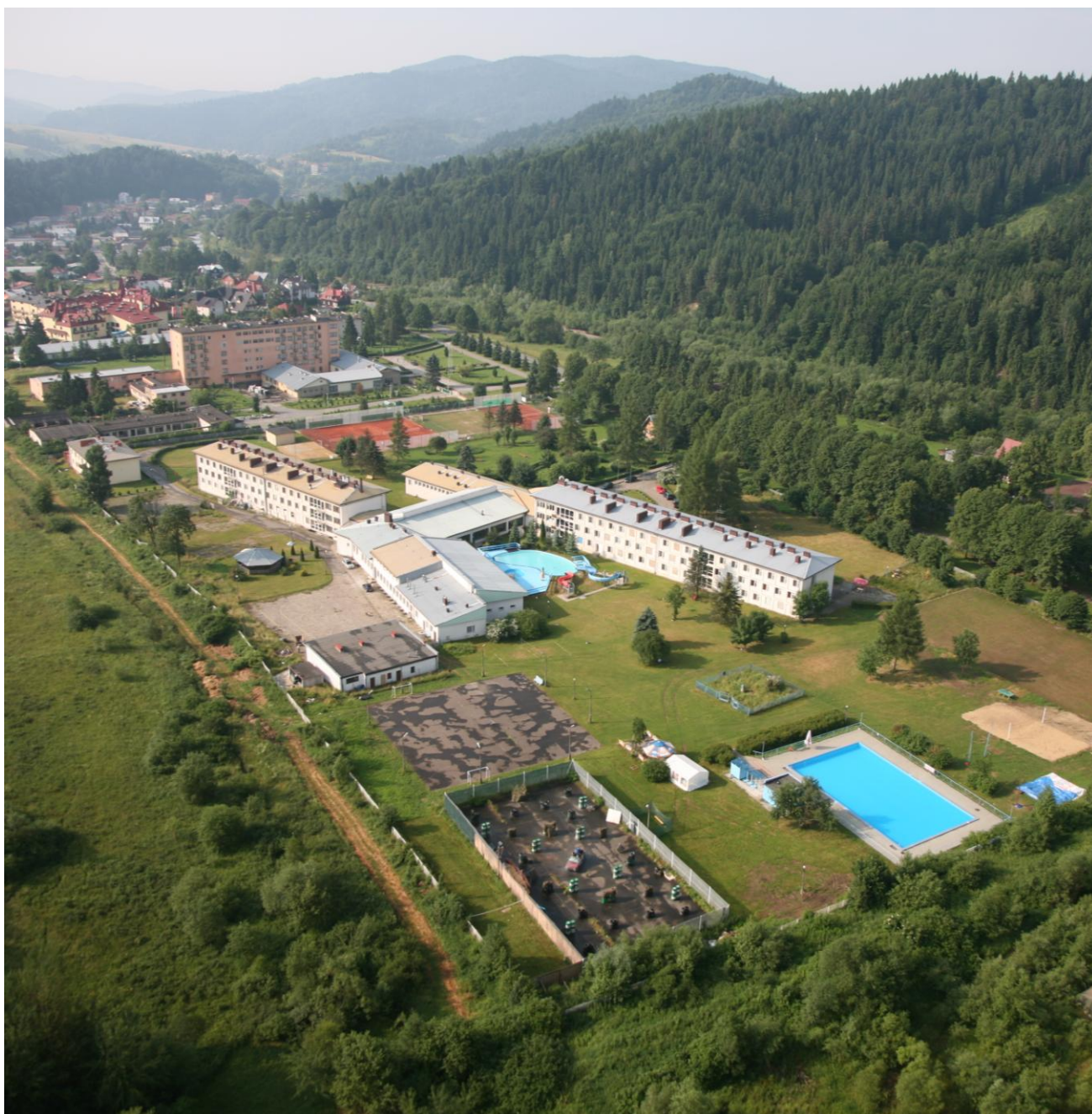
Na zdjęciu: Dom Wczasowy „KOLEJARZ”.

Szczegóły tras oraz powrotu do obozowiska będą omawiane każdorazowo na odprawach kierowników drużyn.