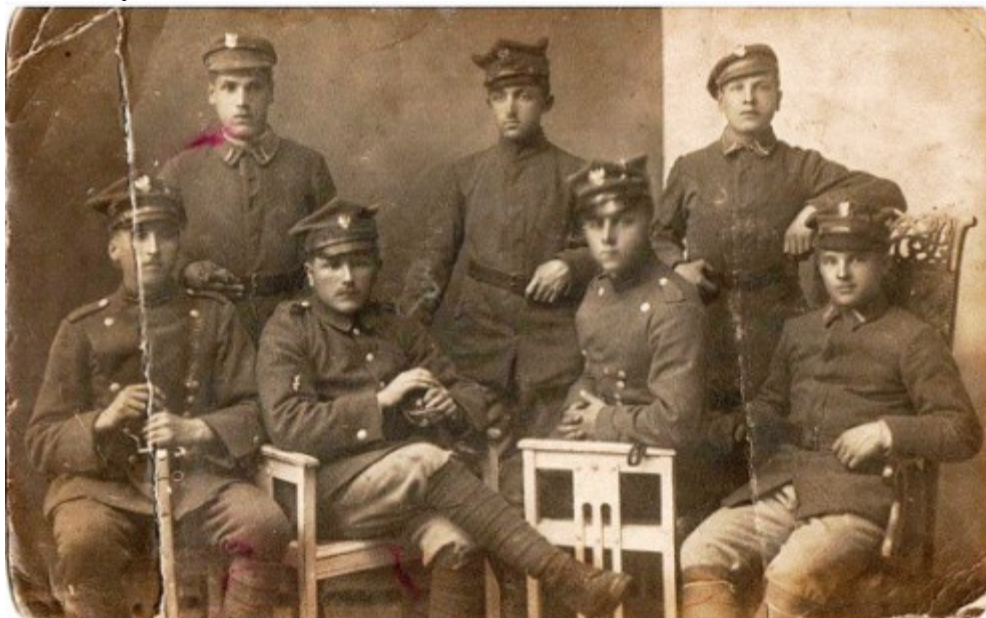
Fot. nr 4 – żołnierze powstańczy jednej z drużyn bojowych Straży Ludowej.